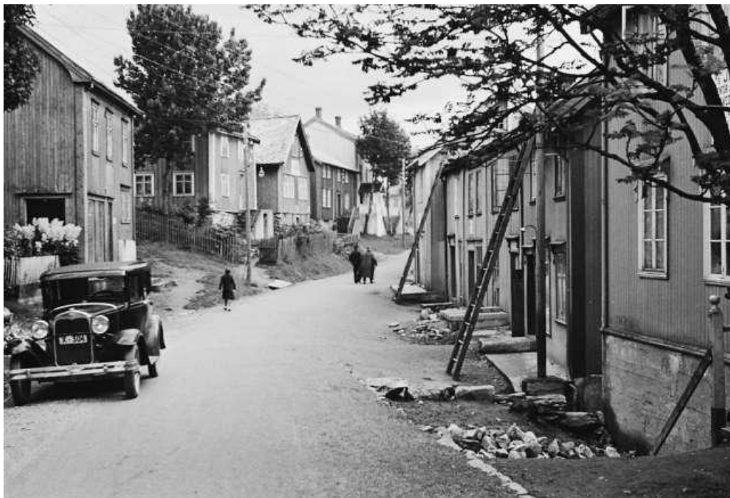
Hemnesberget 1936.