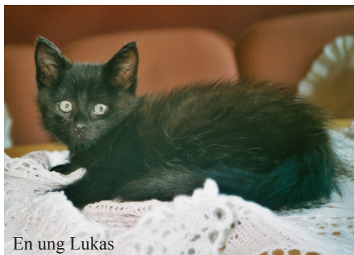
En ung Lukas